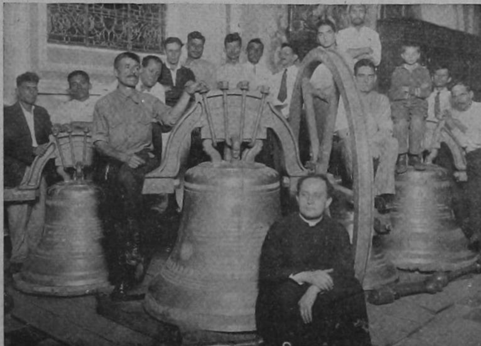
Algunos de los ayudantes voluntarios en armar las nuevas campanas